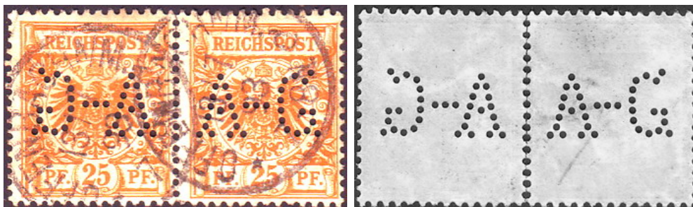
Beispiel für eine durch Faltung entstandene spiegelverkehrte Lochung

Des Öfteren wurden die Marken in Streifen übereinander gelegt oder gefaltet und dann mittels eines Lochungsapparates durchlocht. Durch die verschiedenen Techniken des Faltens entstanden spiegelverkehrte oder auch Kopf stehende Lochungen.