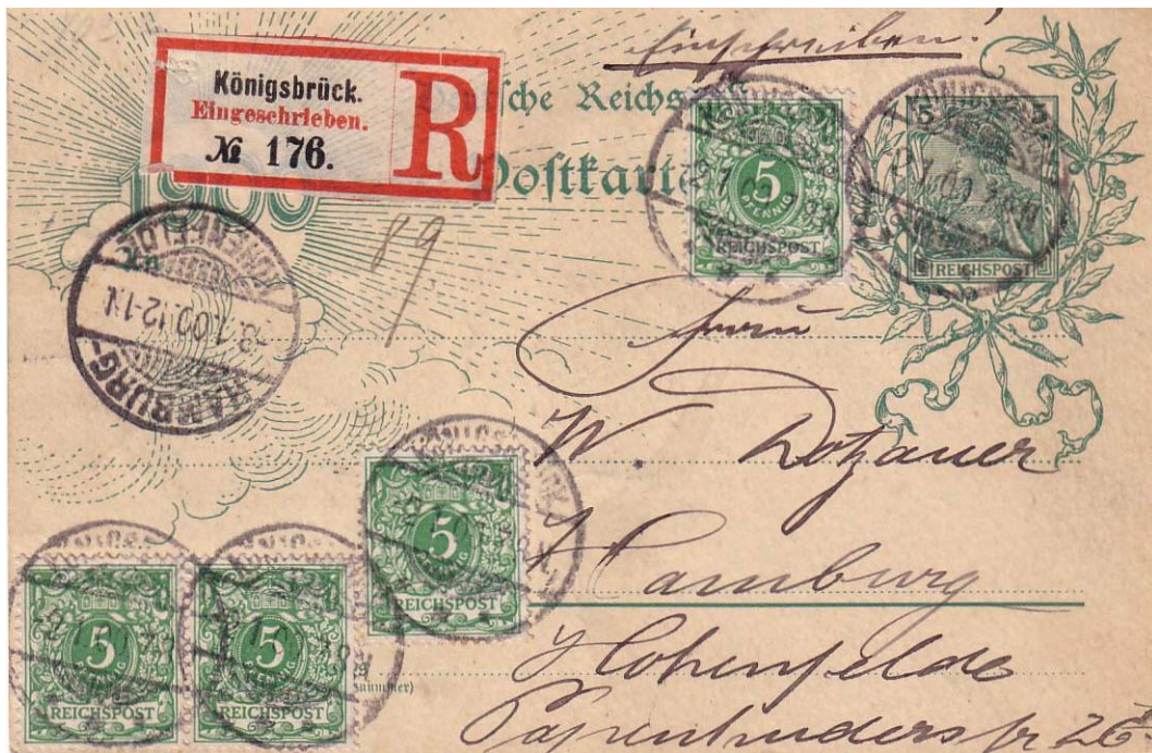
P43 mit Zusatzfrankatur Nr.46 (4x) als Fernpostkarte mit Einschreiben von Königsbrück nach Hamburg-Hohenfelde vom 2.1.1900

Eingeschriebene Jahrhundertkarten kann man schon einmal finden, aber eine solche Portodarstellung ist doch nett.