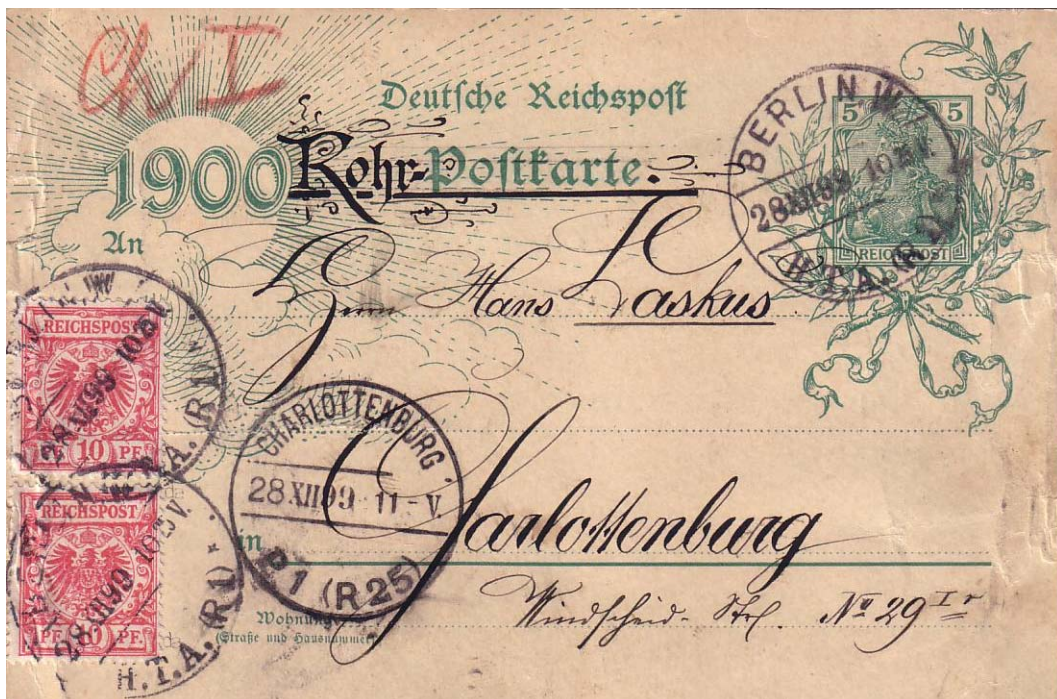
P43 mit Zusatzfrankatur Nr.47 (2x) als Rohrpostkarte in Berlin verwendet am 28.12.1899

Eingeschriebene Jahrhundertkarten kann man schon einmal finden, aber eine solche Portodarstellung ist doch nett.