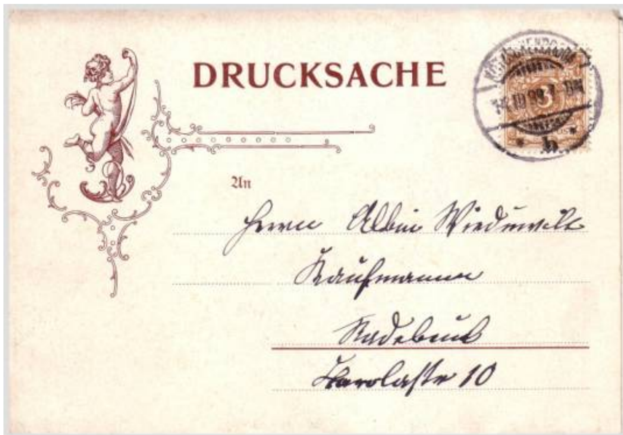
Wunderschöne Optik auf der Vorderseite,