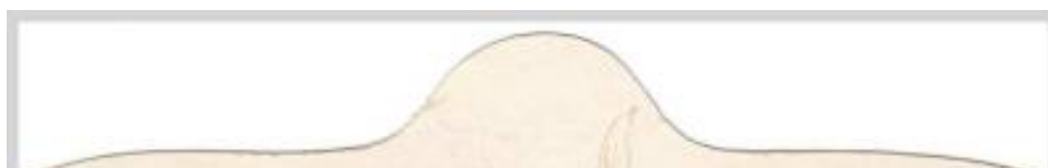
Klappt man das Ganze dann schließlich auf,