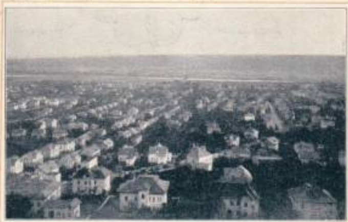
Blick von der Friedensburg